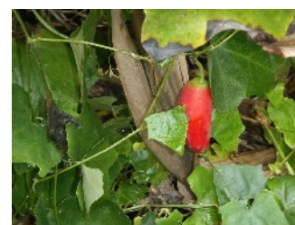
Coccinia grandis , famille Cucurbitaceae, courge écarlate (M. Chabalière, Ercane)