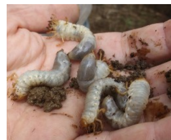
Larves de vers blancs (M. Chabalière, Ercane)

Évaluation du risque : Les précipitations abondantes ont favorisé le développement des lianes. Elles s'enroulent autour des cannes et tissent un réseau de liens entre les tiges, en grimpant sur celles-ci, et finissent par trouver la lumière et recouvrir la