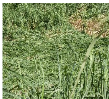
Verse de la canne (variété R584) sur Saint-Pierre

Suite à la perturbation tropicale Imelda début avril 2013, un renforcement des alizés a été enregistré dans le Sud de La Réunion. Suite à ces vents, des phénomènes de verse de la canne ont été observés sur les variétés R575, R582, R584 dans la commune de Saint-Pierre aux lieux dit Bassin Martin, Bassin Plat, Terre Rouge et Ligne Paradis. Ces phénomènes ont été constatés au mois de mai 2012 sur ce même secteur (cf BSV N°1, 28 juin 2012).