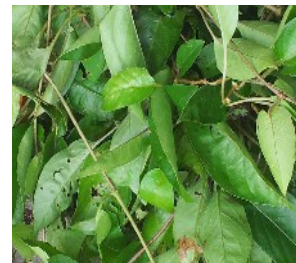
Peaderia foetida , famille Rubiaceae, liane cou de pète

Moyen de lutte : Une intervention manuelle est le seul recours pour limiter la propagation de cette espèce envahissante, mais son système racinaire bien ancré dans le sol rend son élimination très difficile.