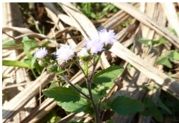
Herbe à bouc, Ageratum conyzoides (J. Antoir, CA)