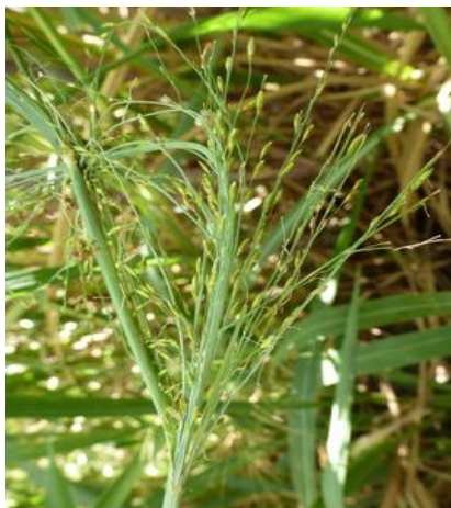
Fataque, Panicum maximum (J. Antoir, CA)

L'observation de Fataques, Panicum maximum a été signalée sur Saint-Joseph. Ceci est dû aux fortes pluies qui perdurent depuis le début de l'année 2016. De plus, il a été noté par la Chambre d'agriculture une diminution des cochenilles et des borers sur cette même commune.