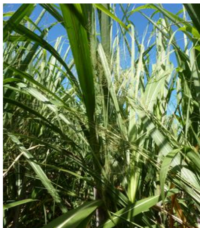
Panicum maximum en concurrence avec la canne à sucre (J. Antoir, CA)