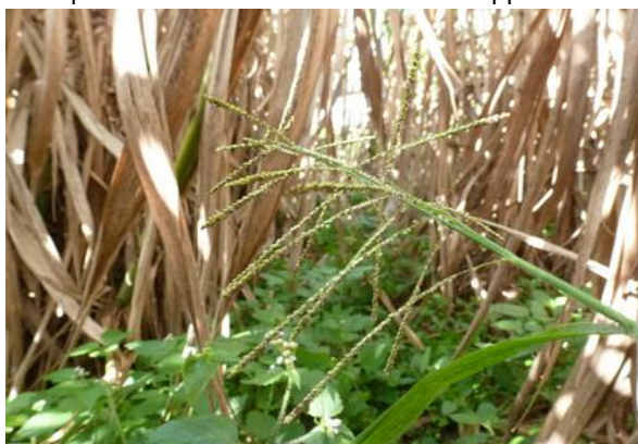
Herbe duvet, Paspalum paniculatum (J. Antoir, CA)

Pour ce mois de juin, les pressions d'enherbement continuent à être basses sur les parcelles du réseau. Elles n'ont toujours pas progressé malgré les précipitations du mois. Les cannes à sucre sont bien développées et couvrant le sol, elles empêchent les adventices de se développer.