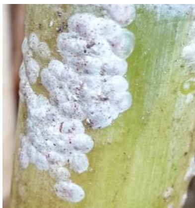
La cochenille Aulacapsis tegalensis (J. Antoir, CA)

- Pas d'évolution des thrips sur les parcelles du réseau.