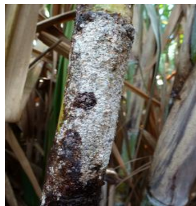
Forte attaque de Aulacapsis tegalensis (J. Antoir, CA)