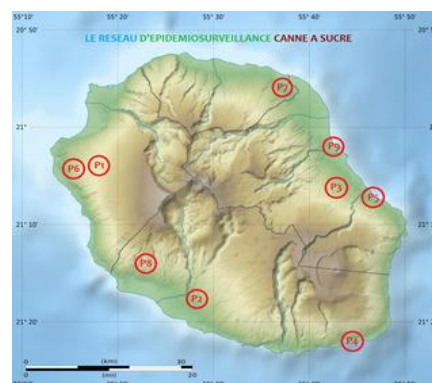
Répartition géographique des parcelles

Dans le cadre du réseau d'épidémiosurveillance, des observations sont réalisées sur 9 parcelles réparties sur l'ensemble de l'île tous les mois. Cette surveillance biologique concerne les bioagresseurs, dont les adventices. Les périodes d'observation sont adaptées en fonction de la région et du type de ravageurs et d'adventices. Celles-ci se font, soit par comptage, soit par notation de présence ou d'absence.