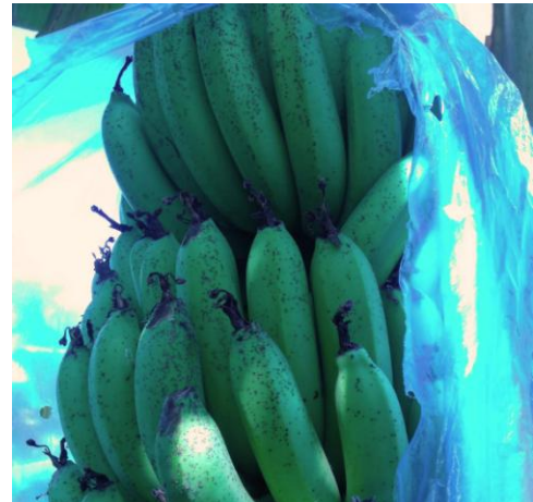
Figure 4 : Mouchetures sur fruits (A. Donnard, SICA TR)