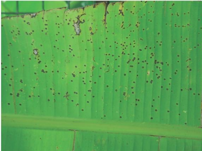
Figure 1 : début de mouchetures sur feuille