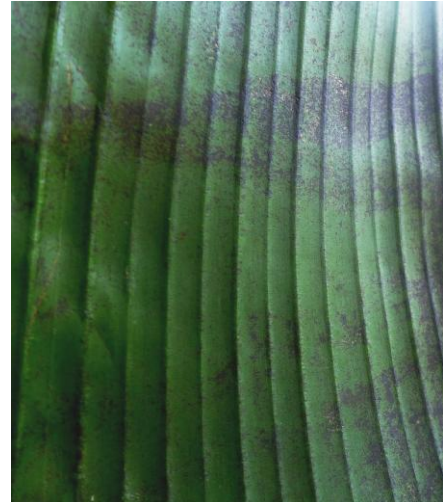
Figure 2 : développement des mouchetures (A. Donnard, SICA TR)