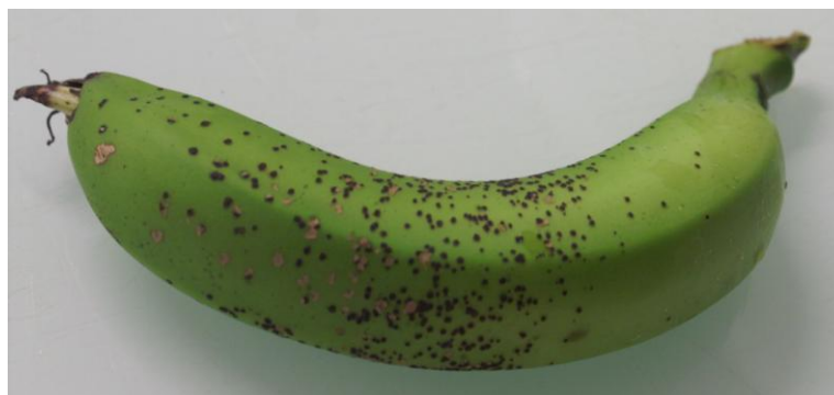
Figure 5 : Gros plan sur les symptômes sur fruits

Remarque : en plus de l'aspect moucheté, les organes infectés donnent au toucher une sensation de "papier de verre" du fait de la structure des spores qui sont insérées dans les tissus et qui les traversent. Cette maladie n'a aucune incidence sur la chair et les qualités gustatives des fruits.