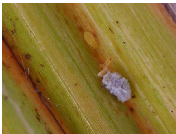
Larve de coccinelle

Soyez vigilant et signalez toutes observations suspectes de pucerons sans délai à la Chambre d'agriculture au 0262 37 48 22, à la FDGDON (OVS Végétal) au 0262 45 20 00 ou à la DAAF Service de l'alimentation au 0262 33 36 68.