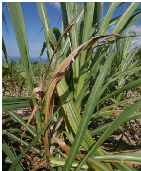
Souche de canne attaquée par le borer rose, Sesamia calamistis

- Les thrips sont toujours présents sur les parcelles P2, P3, P4, P6 et P7. On note leur apparition sur la P8.