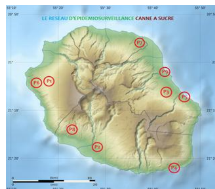
Répartition géographique des parcelles

Dans le cadre du réseau d'épidémiosurveillance, des observations sont réalisées sur 9 parcelles réparties sur l'ensemble de l'île tous les mois. Cette surveillance biologique concerne les bioagresseurs, dont les adventices. Les périodes d'observation sont adaptées en fonction de la région et du type de ravageurs et d'adventices. Celles-ci se font, soit par comptage, soit par notation de présence ou d'absence.