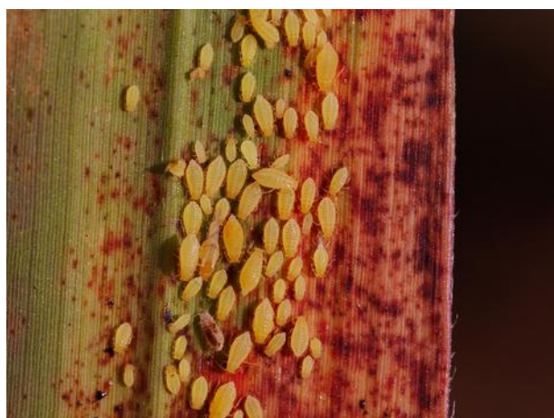
Puceron jaune Sipha Flava (J. Antoir, CA)

A La Réunion, un autre puceron est déjà répertorié sur la canne à sucre, il s'agit de Melanaphis sacchari . Il ne faut pas les confondre.