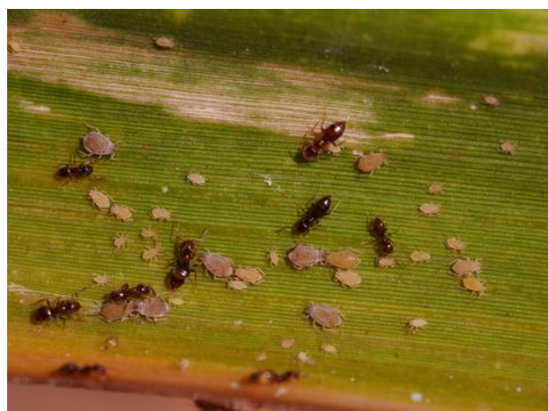
Puceron Melanaphis sacchari (J. Antoir, CA)

Le prélèvement de sève va provoquer comme impact direct l'affaiblissement de la plante. De plus, l'injection de la salive du puceron dans les tissus provoque une réaction de la plante dont les feuilles rougissent. Ce puceron est aussi vecteur du SugarCane Mosaic BVirus (SCMV) déjà présent sur notre île.