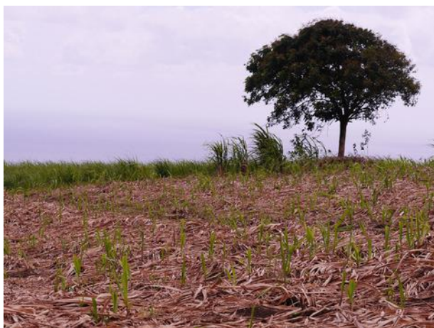
Paillage sur 100% de la parcelle (J. Antoir, CA)