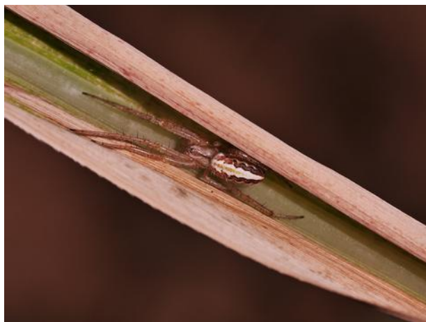
Araignée : Neoscona sp. (J. Antoir, CA)

Des auxiliaires ont déjà été repérés au niveau des foyers de Sipha flava :