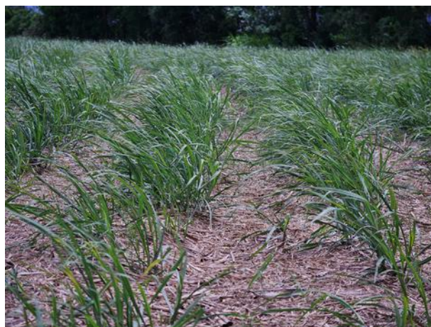
Paillage sur 100% de la parcelle (J. Antoir, CA)