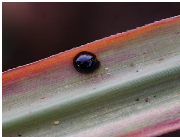
Coccinelle : Exochomus laeviusculus (J. Antoir, CA)