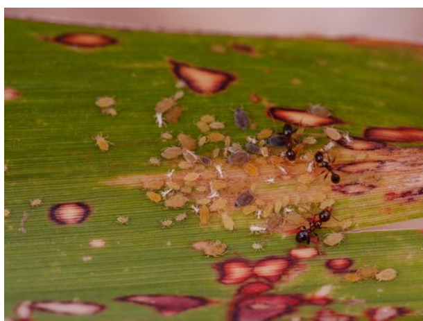
Tache rougeâtre sur feuille âgée

Le prélèvement de sève va provoquer comme impact direct l'affaiblissement de la plante. De plus, l'injection de la salive du puceron dans les tissus provoque une réaction de la plante dont les feuilles rougissent. Ce puceron est aussi vecteur du SugarCane Mosaic BVirus (SCMV) déjà présent sur notre île.