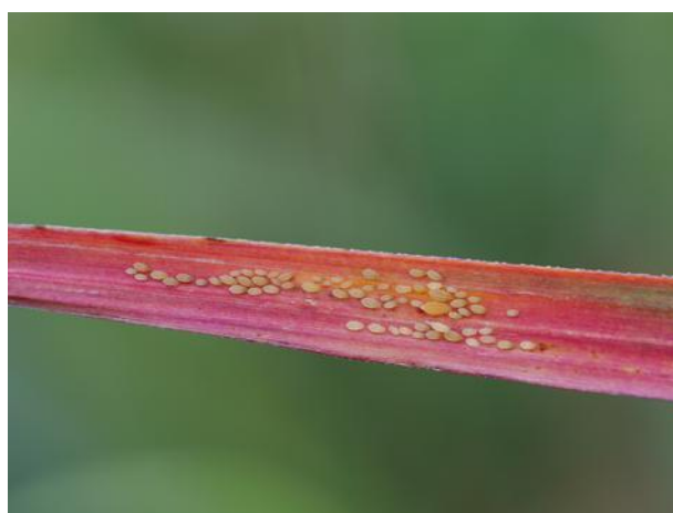
Rougisement d'une jeune feuille (J. Antoir, CA)