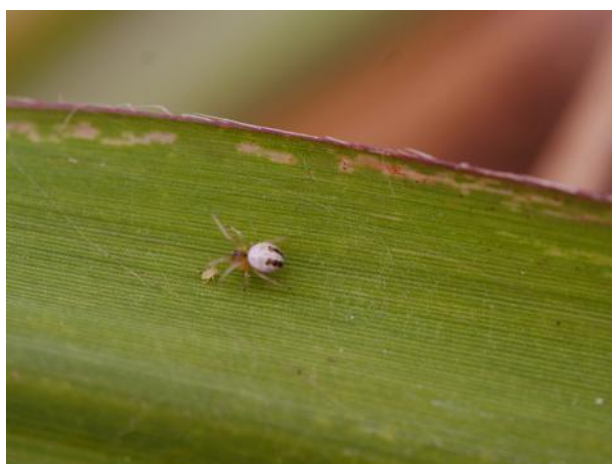
Jeune araignée (J. Antoir, CA)