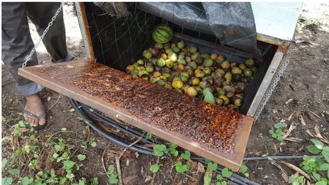
Augmentorium contre les mouches des fruits (S. Cadet, C.A)