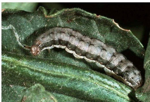
Chenille de S. frugiperda