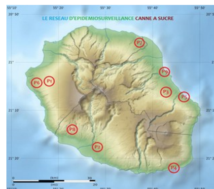
Répartition géographique des parcelles

Dans le cadre du réseau d'épidémiosurveillance, des observations sont réalisées sur 9 parcelles réparties sur l'ensemble de l'île tous les mois. Cette surveillance biologique concerne les bioagresseurs, dont les adventices. Les périodes d'observation sont adaptées en fonction de la région et du type de ravageurs et d'adventices. Celles-ci se font, soit par comptage, soit par notation de présence ou d'absence.