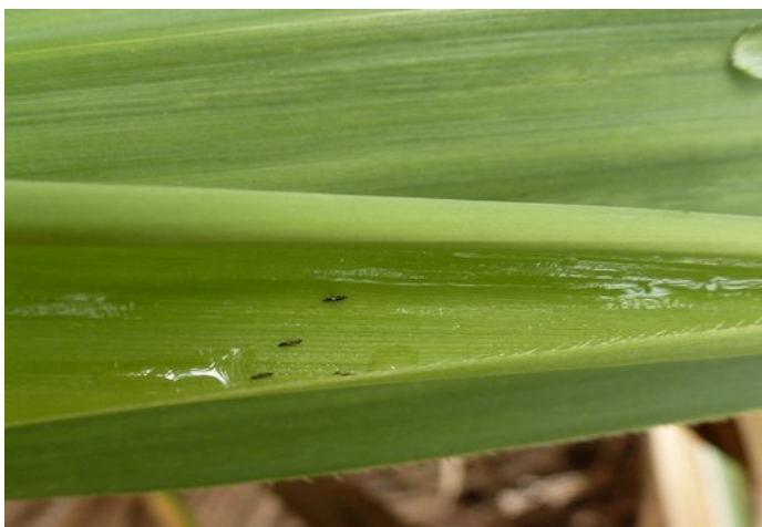
Thrips sur canne à sucre (J. Antoir, CA)