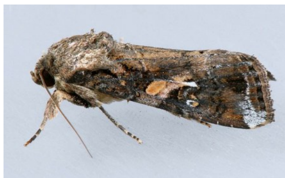
Adulte de S. frugiperda