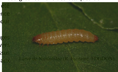
Larve de Nitidulidae

Seuls des scarabées de la famille des Nitidulidae ont été trouvés. Ils sont polyphages et considérés comme des ravageurs mineurs. Ils sont retrouvés dans divers habitats, se nourrissant de fleurs, de fruits, de sève, de champignons, de tissus végétaux en décomposition et en fermentation ou même de tissus d'animaux morts.