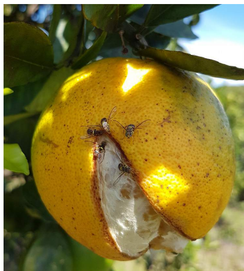
Plusieurs B. dorsalis sur orange (R. Fontaine, FDGDON)

Plusieurs attaques de B. dorsalis sont remontées par la FDGDON sur orange, mandarine, etc. dans la zone Sud et sur calamondin dans l'Est. La mouche orientale des fruits compte parmi ses plantes hôtes privilégiées les agrumes . Surveiller vos parcelles à l'aide de pièges de surveillance et réaliser un traitement par taches à l'aide de Syneis appat® si les captures dépassent 25 à 30 mouches par semaine et si des piqûres sont observées. Le ramassage et la destruction des fruits piqués est essentiel pour stopper le développement des populations sur la parcelle. Au lieu de les détruire, vous avez la possibilité de les disposer dans un augmentorium pour favoriser la micro-guêpe parasite, Fopius arisanus . La présence d'un enherbement permanent et/ou de bandes fleuries permet de maintenir la présence des insectes utiles sur la parcelle.