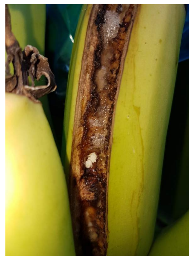
Ponte de B. dorsalis sur une banane verte abîmée