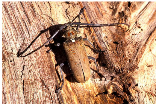
Batocera rufomaculata sur manguier

Pour plus d'informations sur ce ravageur, référez-vous au focus du BSV fruits d'avril 2016 en cliquant sur le lien suivant : BSV avril 2016 .