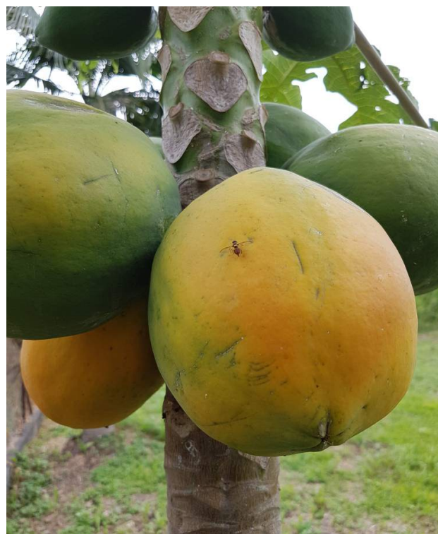
Bactrocera dorsalis sur papaye

Les mesures de gestions à appliquer sont les mêmes que pour les cultures précédentes.