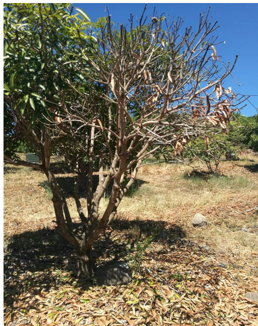
Attaque de longicorne (J. GRONDIN, CA)