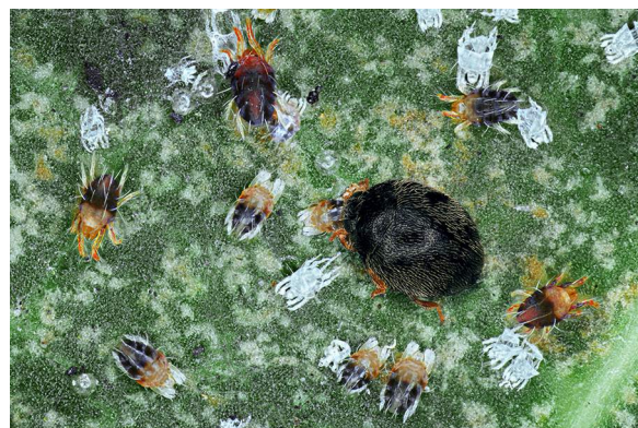
P. incompletus sur foyer de Tétranyque

Elle représente une bonne alternative contre les tétranyques en verger d'agrumes. De bonnes pratiques agricoles sont à adopter pour qu'elle s'implante durablement sur sa parcelle.