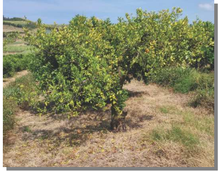
R. Fontaine (FDGDON)

La maladie entraîne une réduction importante de la végétation (rabougrissement) et de la production de fruits (taille et quantité) .