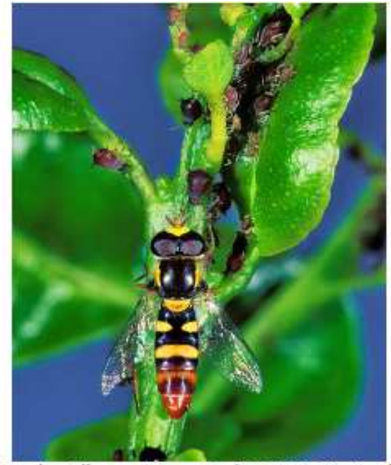
Syrphe Allograpta nasuta