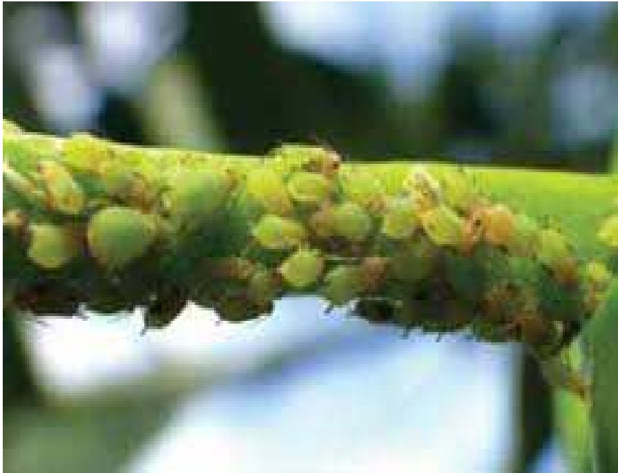
Aphis spiraecola (puceron vert)