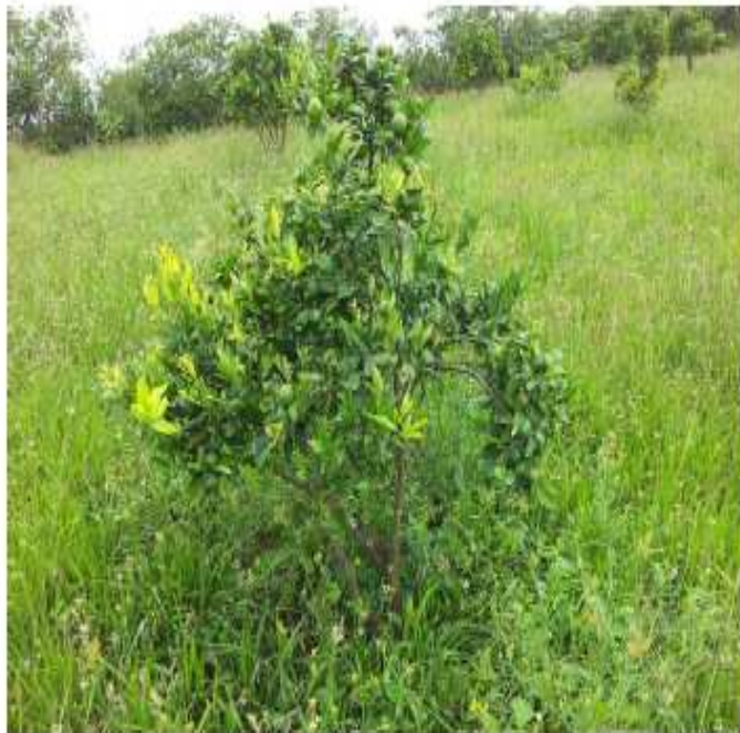
Enherbement en verger d'agrumes