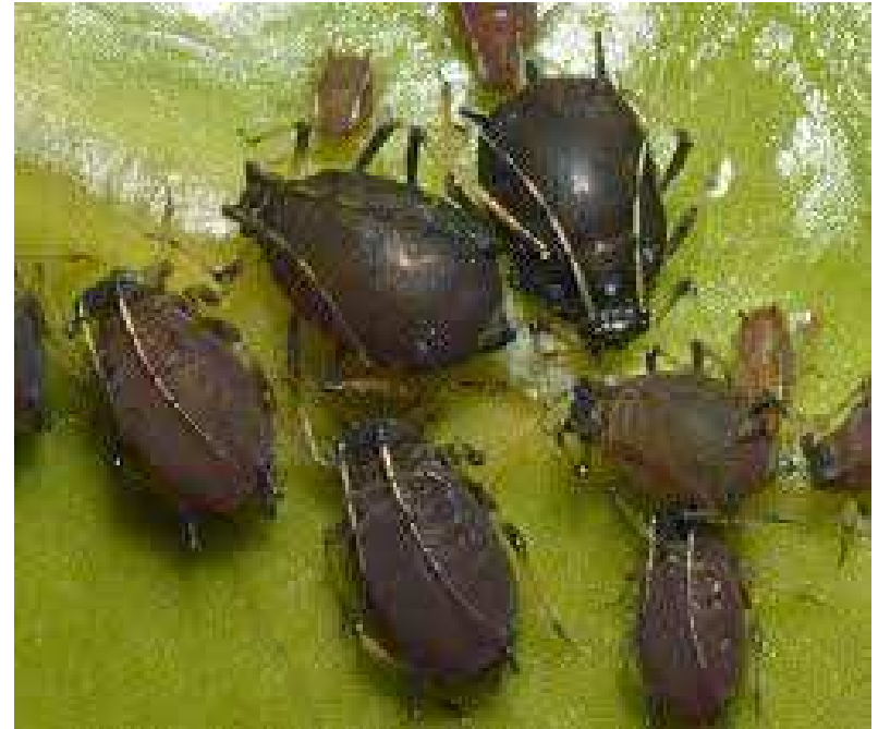
Toxoptera aurantii (puceron noir)

Catalogue illustré des principaux ravageurs et auxiliaires des cultures de Guyane