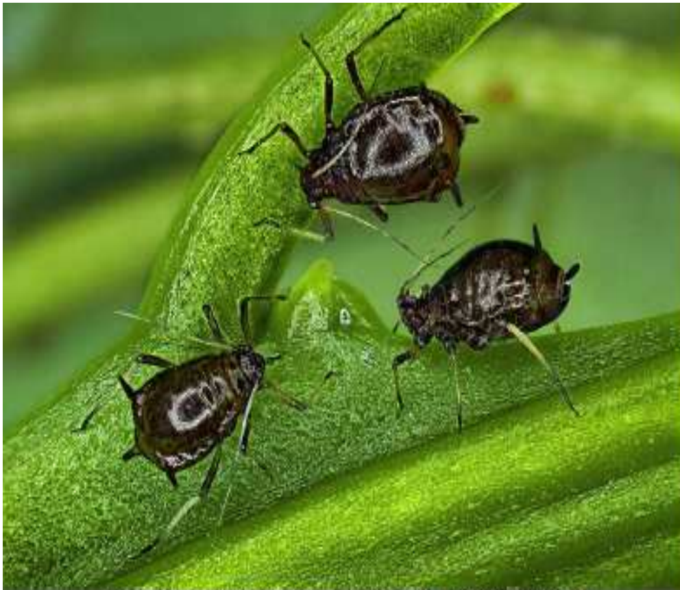
Toxoptera citricidus sur agrumes