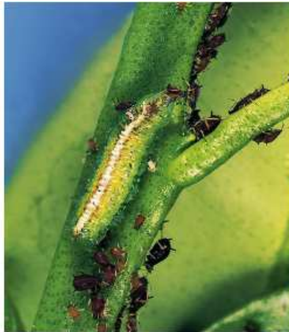
Larve de syrphe