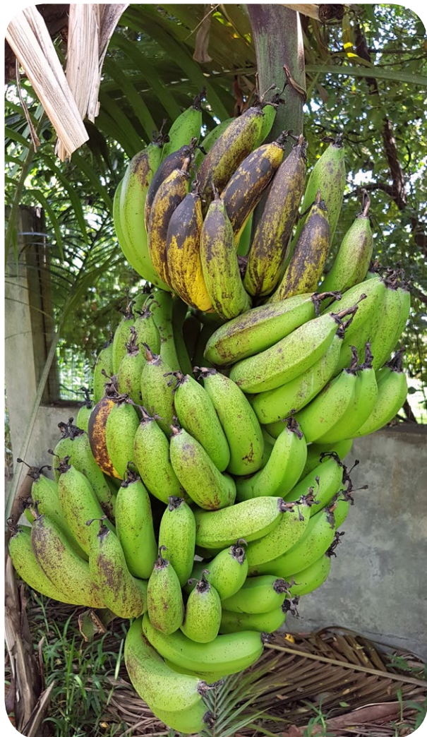
Régime entièrement attaqué