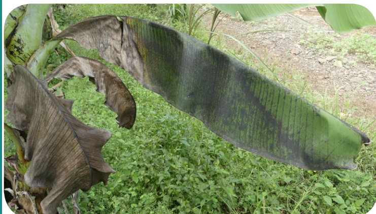
Mouchetures généralisées et nécroses