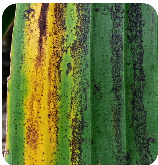
Gros plans sur les spores et début de jaunissement