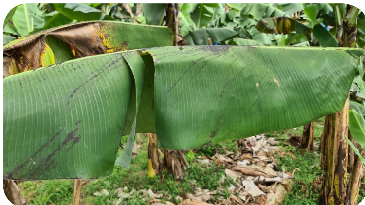
Taches en ligne oblique (infection par projection d'eau)