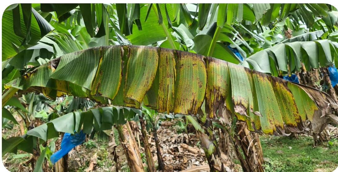
Stade avancé avec début de nécrose et jaunissement généralisé