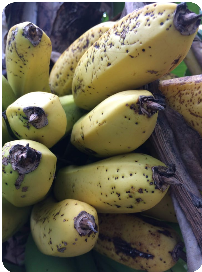
Mouchetures partielles sur bananes mures