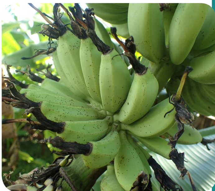
Mouchetures sur jeunes bananes

Remarque : en plus de l'aspect moucheté, les organes infectés donnent au toucher une sensation rugueuse de "papier de verre" du fait de la structure des spores qui sont insérées dans les tissus et qui les traversent.